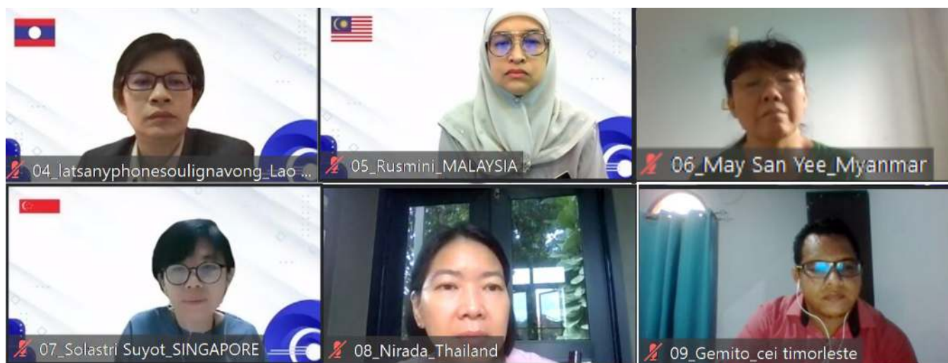
Anggota Dewan Pengurus/Perwakilan SEAMEO QITEP in Language dari Brunei Darussalam, Cambodia, Indonesia, Lao PDR, Malaysia, Myanmar, Singapore, Thailand, dan Timor Leste

guru bahasa dan tenaga kependidikan di Asia Tenggara, selama dan pascapandemi. Pada Tahun Anggaran 2021/2022, SEAQIL melayani lebih dari 4.000 guru dan tenaga kependidikan dan melibatkan lebih dari 100 pakar melalui berbagai kegiatan pengembangan kapasitas.”