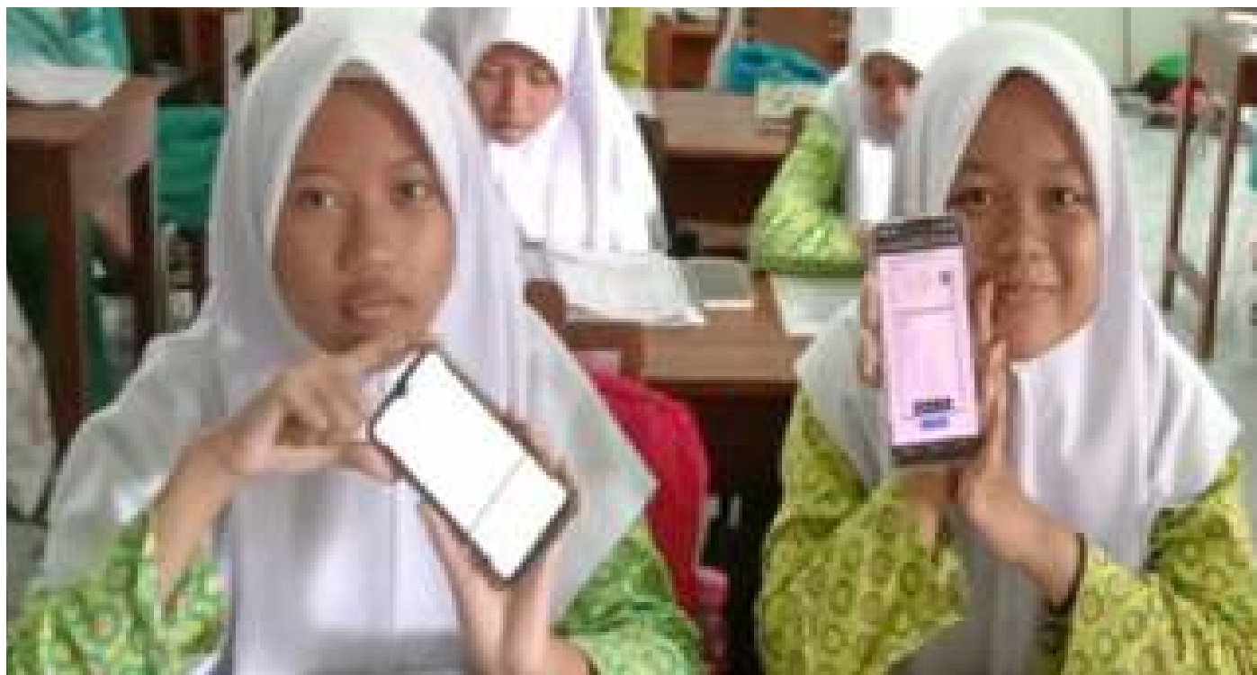
Peserta menggunakan kamus glosarium digital di android yang terintegrasi dengan aplikasi Elma Participants use a digital glossary dictionary on Android which is integrated with the Elma application

Aspects of student completion in terms of English subject matter narrative text material in pre-cycle activities increased to 9 people in cycle I, so if it is percentage, the increase from pre-cycle to cycle is 50%. This is quite pleasant for the teacher because the number of students who have attained the stated